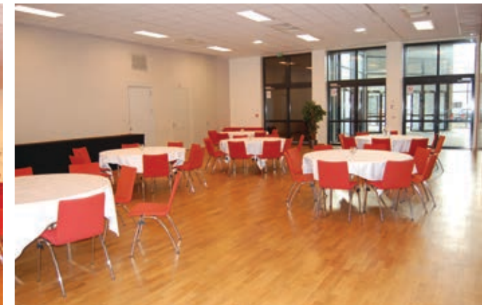
Salle Patio Sud 6