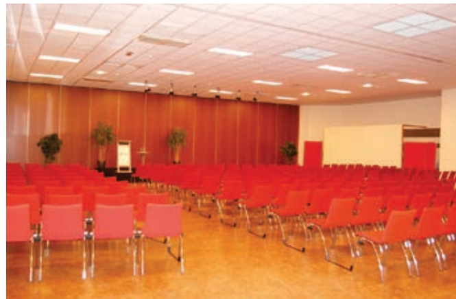
Patio Sud 4+5