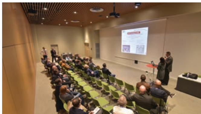
Salle Mezzanine 2