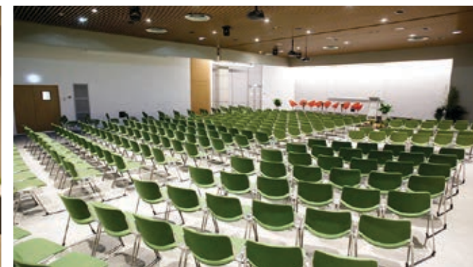
Salles Mezzanine 2+3+4