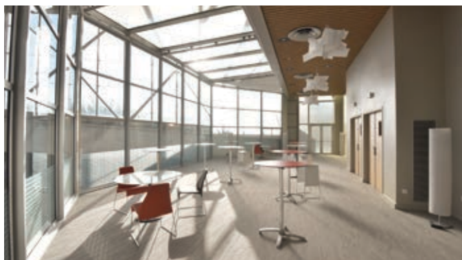
Salle Mezzanine 1

(1) La salle Mezzanine 1 n'est pas occultable (pas de possibilité de vidéoprojection).