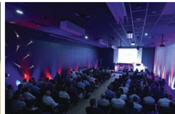
Salle Lumière 9