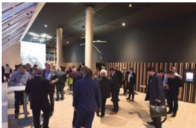
Accueil principal Lumière