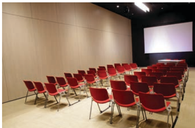
Salle Lumière 10